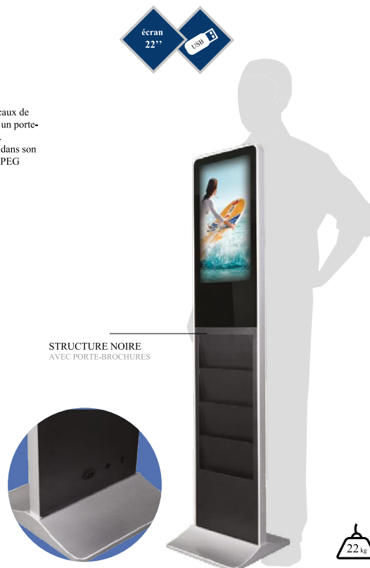
STRUCTURE NOIRE AVEC PORTE-BROCHURES

Le totem TV 1 22" (55,9 cm) propose une alternative de taille réduite aux modèles verticaux de 42" à 55". Il est présenté en 2 versions, avec un porte-brochures sur 4 niveaux dans sa version noire. Il comporte un large visuel aimanté en option dans son interprétation blanche. La lecture des images JPEG ou vidéos MP4 s'effectue via une clé USB. La lecture se fait en boucle. Poids : 22 kg